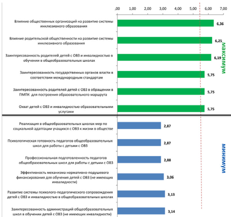
Рис. 1. Максимальные и минимальные оценки при ответе на вопрос: «Оцените, пожалуйста, текущее состояние системы инклюзивного образования в г. Москве по 10-балльной шкале, где 1 – самая низкая оценка, 10 – самая высокая оценка», в показателях среднего значения.

В ходе анализа данных исследования выяснилось, что в профессиональном сообществе экспертов в сфере инклюзивного образования практически отсутствует единое понимание текущих процессов . Некоторое консолидированное мнение экспертов прослеживается только по признанию проблемными отдельными аспектами: недостаточность инклюзивных школ в г. Москве, отсутствие в общеобразовательных школах психолого-педагогического сопровождения детей с ОВЗ и инвалидностью, а также специальных образовательных условий, в том числе программ по социальной адаптации, и низкий уровень психологической готовности педагогов к переходу на новую модель обучения (стандартное отклонение 8 в интервале от 1,52 до 1,74 и средние оценки не превышают 3,29).